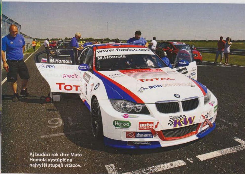
Aj budúci rok chce Maťo Homola vystúpiť na najvyšší stupeň víťazov.

Tím Homola Motorsport. Po náročnej prelomovej sezóne 2012 už prebiehajú prípravy na ďalší rok. Text: Štefan Rosival